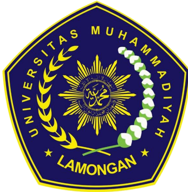
Gambar 2.1 Logo Universitas Muhammadiyah Lamongan

Universitas Muhammadiyah Lamongan atau disingkat UMLA adalah salah satu Institusi pendidikan tinggi yang berada di kota Soto tepatnya di kabupaten Lamongan propinsi Jawa Timur. UMLA berdiri pada tanggal 12 Oktober 2018, berdasarkan SK Menteri Ristek Dikti Nomor 880/KPT/I/2018 tentang Ijin Universitas Muhammadiyah Lamongan. SK tersebut langsung diberikan oleh Presiden RI Joko Widodo, bersamaan ijin 6 Perguruan Tinggi Muhammadiyah di Indoneisa, diantaranya Stikes Muhammadiyah Lamongan, Stikes Muhammadiyah Kudus, Stikes Muhammadiyah Wonosobo, Stie Ahmad Dahlan Jakarta, Akademi Kebidanan Aisyiyah Banten, dan Perguruan Tinggi Muhammadiyah Sorong, saat