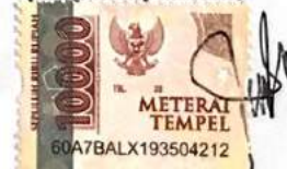
Gading Tio Yuniar