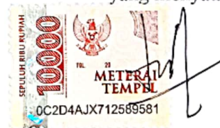
Toni Wahyu Susilo