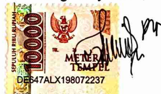
Novika Putri Pratiwi