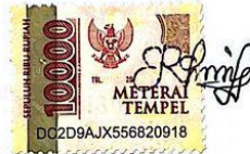
Erni Dwi Astuti