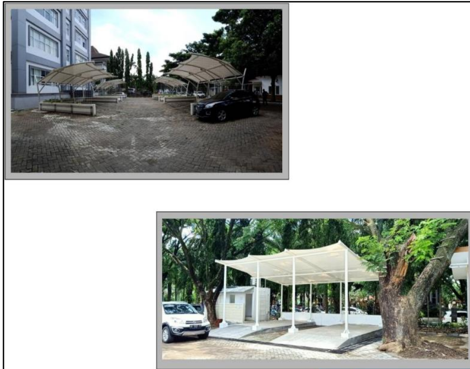
Gambar 2.2 Pengalaman Kerja CV Adhitama Karya Mandiri

konstruksi dan perdagangan jasa. Pengalaman tersebut seperti pembangunan lantai 3 RKB MI Khoirul Huda pada tahun 2017, Pengadaan jasa konstruksi instalasi lift Senyum World Hotel Jatim Park 3 Kota Batu pada tahun 2018, Pembangunan garasi fakultas kedokteran brawijaya pada tahun 2019 dan masih banyak lagi pengalaman perusahaan ini. Beberapa contoh hasil proyek dari CV Adhitama Karya Mandiri dapat dilihat pada Gambar 2.2.