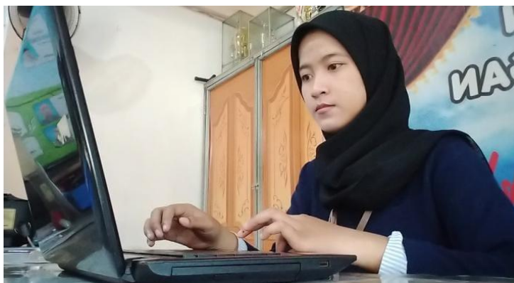
Gambar 5 3 Pengajuan Permohonan Warga