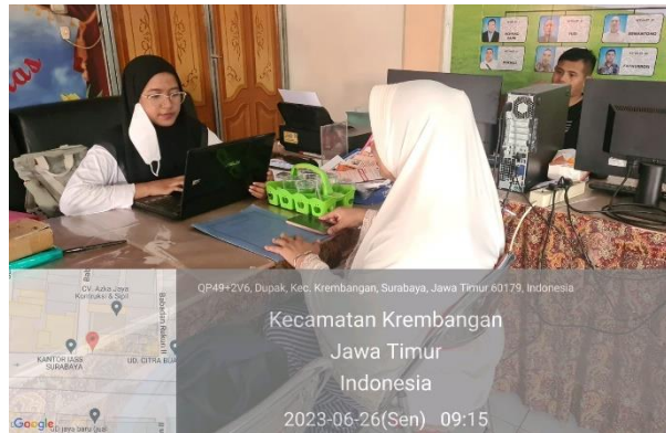
Gambar 5 2 Penyerahan Berkas Persyaratan