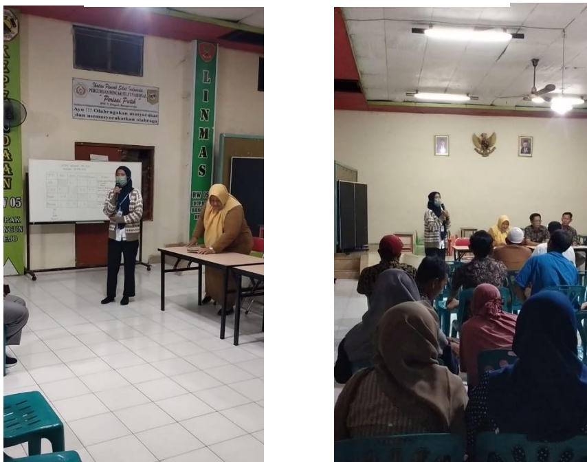
Gambar 5 6 Sosialisasi KNG oleh Kelurahan dan Mahasiswa

Aplikasi Klampid New Generation dilengkapi dengan bermacam-macam permohonan. Dalam pengimplementasian Klampid New Generation telah berhasil dalam memberikan peningkatan pada kualitas pelayanan administrasi kependudukan. Adanya KNG dalam pelayanan administrasi kependudukan menggambarkan bahwa kinerja para aparat birokrasi telah berhasil untuk meningkatkan pemberian pelayanan yang lebih memudahkan warga. Hal tersebut tujuannya tidak lain adalah membuat warga merasa puas atas pelayanan yang mereka terima. Hal ini dibuktikan kinerja para staf atau petugas kelurahan yang telah sangat mahir