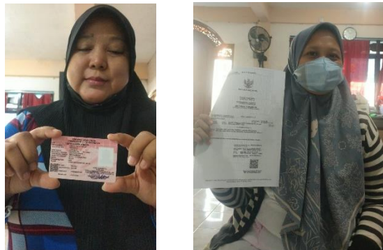
Gambar 5 5 Pengambilan Dokumen