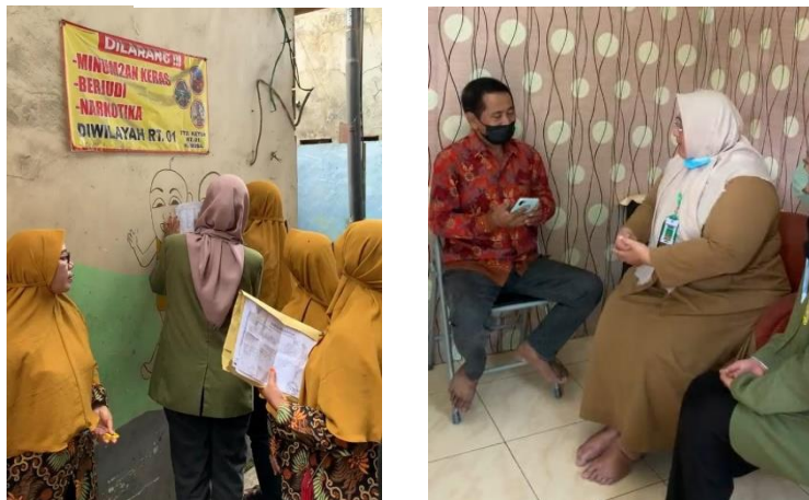
Gambar 5 1 Pelayanan ke rumah warga

Salah satu persyaratan dalam penerbitan kutipan akta kelahiran kedua jika akta kelahiran sebelumnya diterbitkan di luar Kota Surabaya adalah surat keabsahan data. Surat keabsahan data merupakan surat yang secara singkat memuat informasi keabsahan data kependudukan yang diterbitkan Dinas Kependudukan dan Pencatatan Sipil Kabupaten/Kota. Pengajuan keabsahan data juga bisa dilakukan menggunakan KNG, hal ini sangat memudahkan bagi warga karena tidak perlu datang ke Dinas Kependudukan dan Pencatatan Sipil penerbit akta kelahiran sebelumnya. Namun, dalam kondisi dilapangan nya warga Kelurahan Dupak kurang mengetahui adanya fitur ini dalam aplikasi KNG sehingga mereka menganggap bahwa penerbitan kutipan akta kelahiran kedua harus dilakukan di kota asal mereka sebelum berdomisili di Surabaya. Pengajuan keabsahan data bisa dilakukan secara mandiri atau dibantu oleh petugas kelurahan dengan 5-10 hari kerja. Lamanya proses pengajuan keabsahan data dikarenakan tidak semua Dinas Kependudukan dan Pencatatan Sipil di Indonesia memiliki