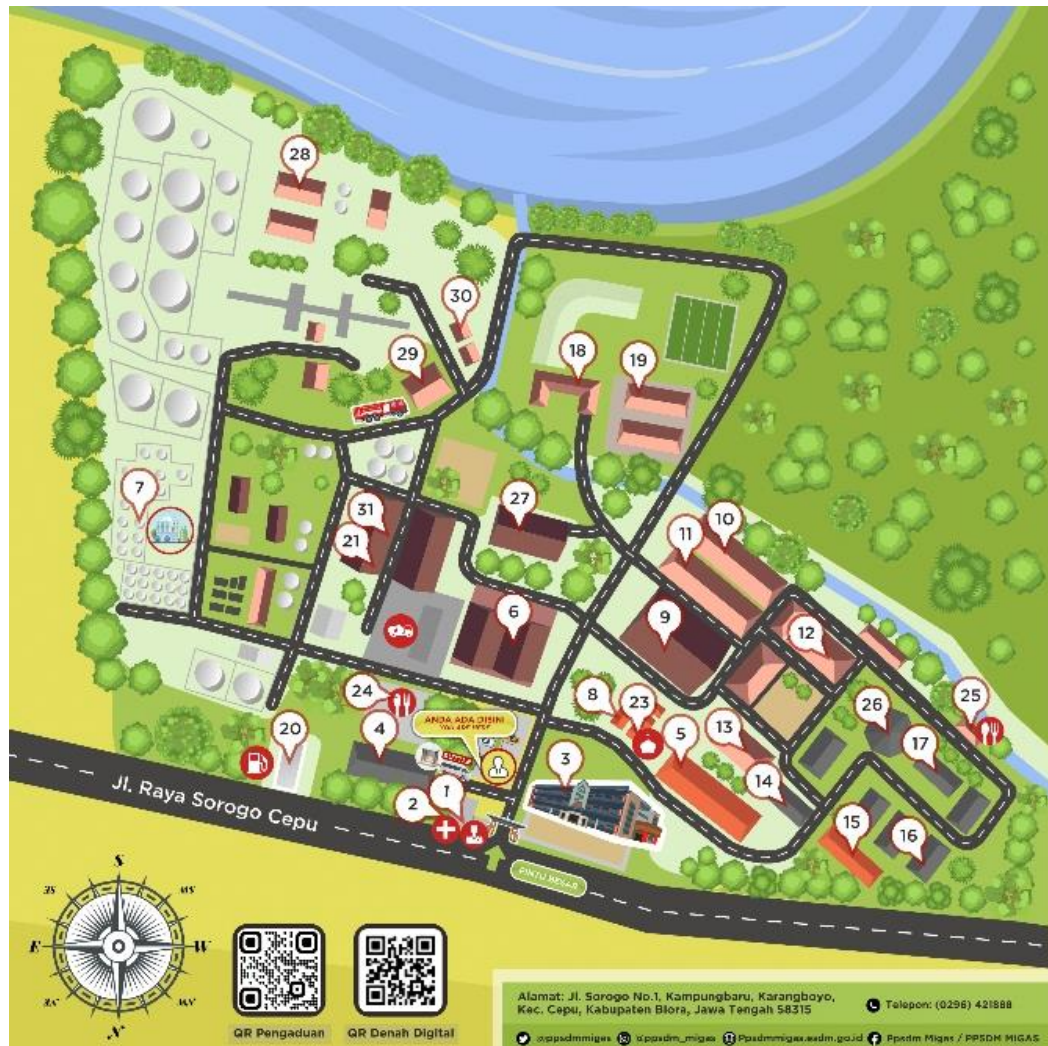
Gambar I. 1 Denah Lokasi PPSDM Migas

Berikut adalah denah lokasi PPSDM Migas Cepu.