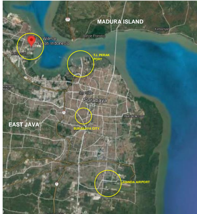
Gambar 1. Peta Lokasi