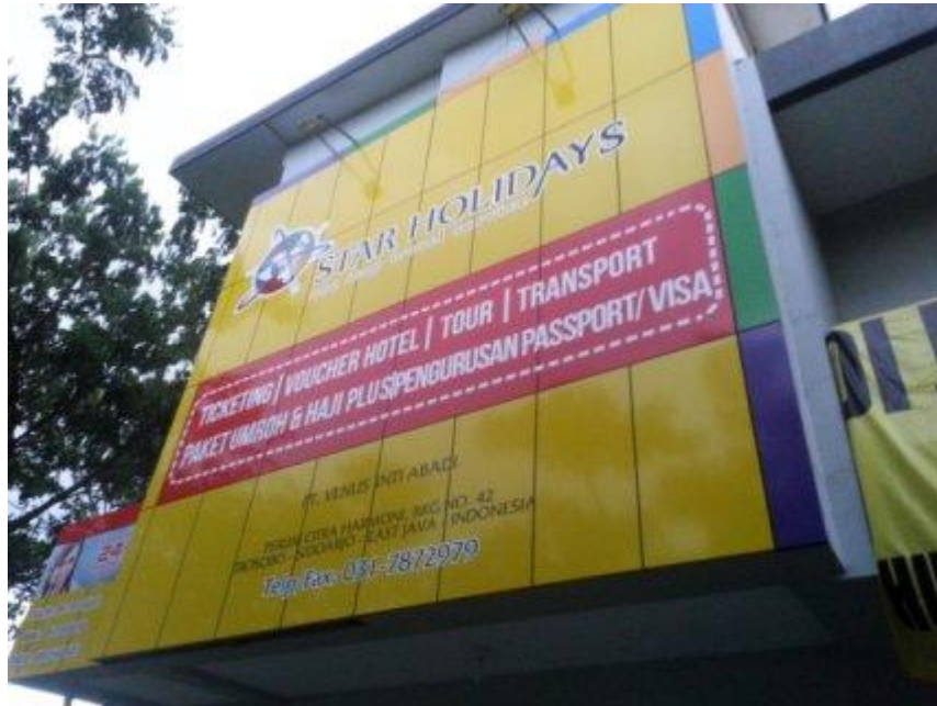
Gambar 3.1 Kantor cabang StarsHolidays di Trosobo Sidoarjo

Kegiatan praktek kerja lapangan ini dilaksanakan pada bulan Mei – Agustus 2016, sesuai dengan yang tertera pada surat penugasan dari UPN Veteran Jawa Timur, dan bertempat di Star Holidays Travel yang berlokasi di Perum. Citra Harmoni, Jl. Kemendung Indah II, Trosobo, Kabupaten Sidoarjo, Jawa Timur. Kantor Stars Holidays Travel dapat dilihat pada gambar 3.1 di bawah ini.