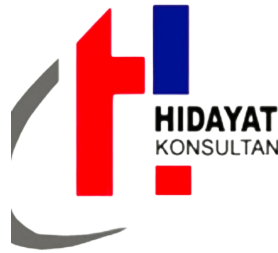
Gambar 2.1 Logo CV. Hidayat Konsultan.