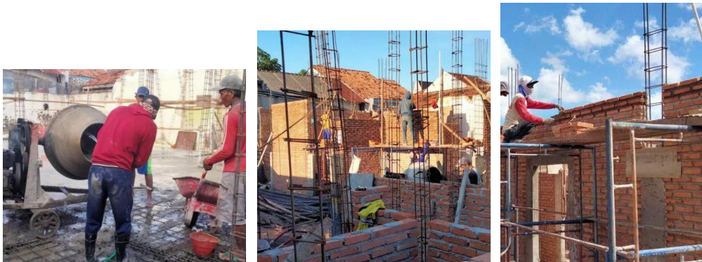
Gambar 2.2 Proses pengecoran plat lantai (kiri), pembuatan dinding (tengah) dan Proses pengecoran kolom struktur (kanan)

Pada saat awal saya melakukan magang mandiri kondisi Proyek rumah tinggal 2 lantai di pamekasan, Madura ini telah masuk pada tahap pengecoran plat lantai. Kemudian Untuk jangka waktu pembangunan rumah tinggal tersebut sudah melewati beberapa hari Pada pekerjaan tahap awal sudah memasuki proses penyusunan dinding dan pengecoran kolom struktur .seperti pada gambar dibawah ini.: