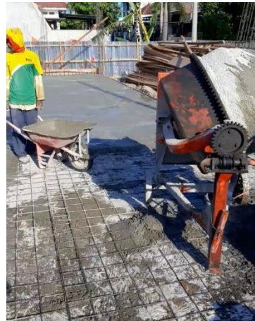
Gambar 2.1 Proses pembuatan sauran air kotor(kiri), dan Proses pengecoran plat lantai (kanan)