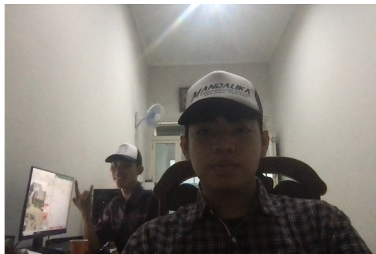
Gambar 2.1b Foto Suasana Kantor