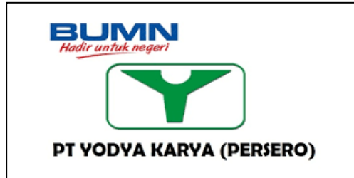
Gambar 2. 1 Logo PT. Yodya Karya (Persero)

PT. Yodya Karya (Persero) merupakan perusahaan BUMN yang berdiri sejak tahun 1961 dan bergerak dalam jasa konsultan teknik, manajemen proyek, dan pengembangan bisnis yang memegang teguh filosofi untuk memberikan jasa terbaik kepada klien dan menghasilkan karya-karya unggul melalui kinerja yang kuat guna mewujudkan visi menjadi konsultan teknik yang handal. Lingkup bidang konsultan di perusahaan tersebut meliputi jasa konsultan perencanaan dan pengawasan.