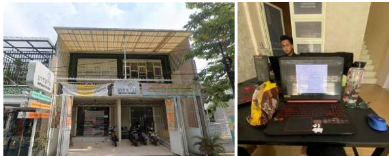
Gambar 2.2 Suasana Kantor dan Ruang Kerja