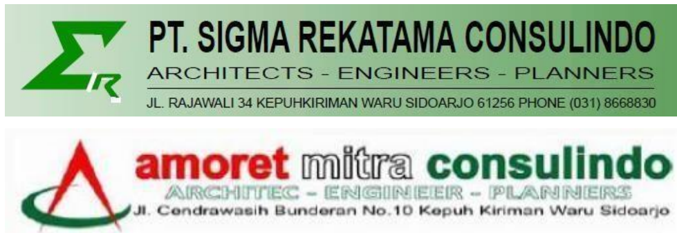
Gambar 2.1 Logo PT Sigma Rekatama Consulindo & Amoret Mitra Consulindo

Nama perusahaan yang dituju adalah PT. Sigma Rekatama Consulindo. PT. Sigma Rekatama Consulindo sendiri merupakan sebuah perusahaan yang bergerak di bidang Perencanaan Arsitektur, Perencanaan Rekayasa, Perencanaan Penataan Ruang, Pengawasan Rekayasa, dan Konsultasi lainnya yang berlokasi di Jalan Rajawali 34 Kepuh Kiriman Waru, Kabupaten Sidoarjo. Dalam kegiatan magang ini, kami ditugaskan untuk membantu proyek dari PT Amoret Mitra Consulindo yang merupakan salah satu anggota grup yang berdiri bersama PT. Sigma Rekatama Consulindo dan bergerak di bidang ahli yang sama. Berikut merupakan logo dari perusahaan PT. Sigma Rekatama Consulindo dan PT. Amoret Mitra Consulindo serta dokumentasi kegiatan selama bekerja di kantor: