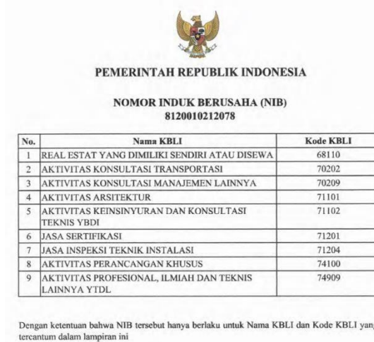
Tabel 2.1 Surat Izin Berusaha

Instansi Pemberi Izin Usaha : Pemerintah Republik Indonesia