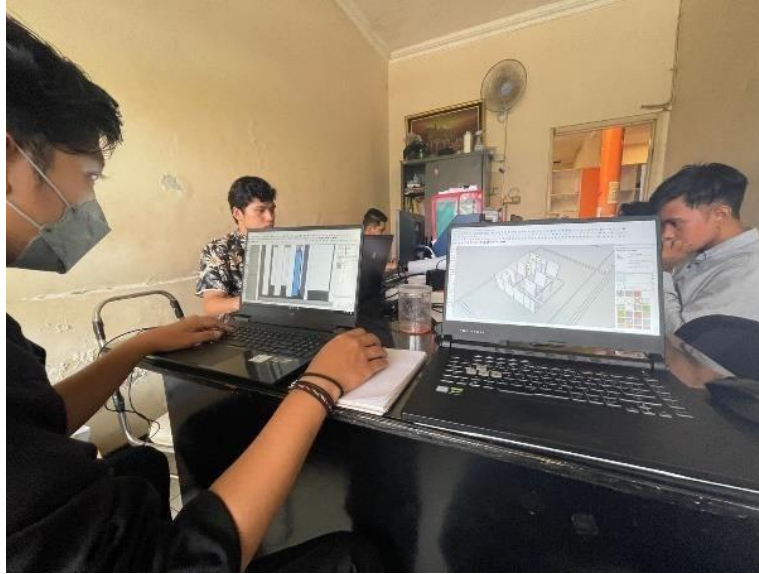
Gambar 2.2 Foto Suasana Kantor

PT adalah sebuah badan usaha yang didirikan berdasarkan aturan di Indonesia, yakni UU Nomor 40 Tahun 2007 tentang Perseroan Terbatas. Merujuk pada UU Nomor 40 Tahun 2007, modal pendirian perseroan terbatas atau PT adalah ditetapkan sebesar Rp 50 juta, kecuali ditentukan lain oleh undang-undang atau peraturan yang mengatur tentang pelaksanaan kegiatan usaha tersebut di Indonesia. Dalam pendirian usaha berbentuk PT adalah diwajibkan ada minimal 2 orang yang terlibat, baik itu WNI atau pun WNA, di mana masing-masing memiliki bagian saham. Pada PT Sigma Rekatama Consulindo ini ada 2 orang yang terlibat sebagai pemilik saham diantaranya adalah Pak Samsul Ansori sebagai Direktur dan Pak Yusuf Effendi sebagai Komisaris.