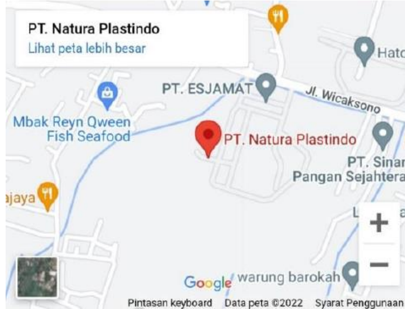
Gambar I.1 Denah Lokasi PT Natura Plastindo

Dasar pemilihan lokasi PT Natura Plastindo berdasarkan atas pertimbangan sebagai berikut: