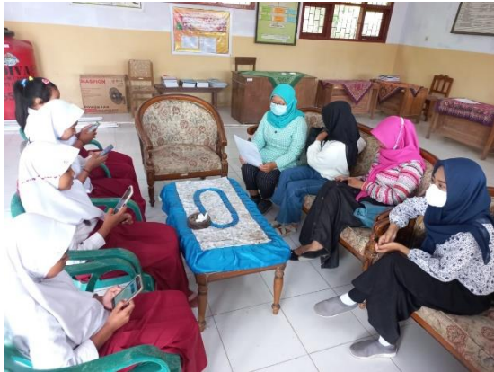
➤ Pelaksanaan ANBK