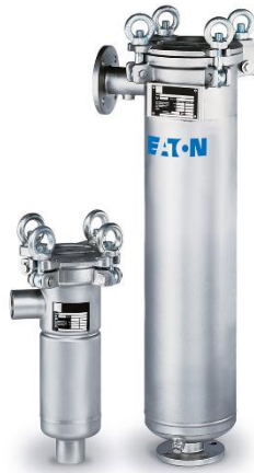
Gambar II.5 Miniline Filter bag Housings