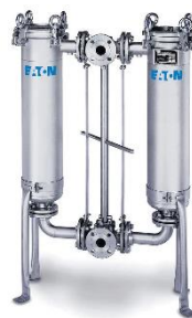
Gambar II.3 Duoline bag housing filter