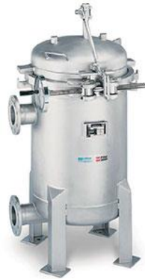
Gambar II.4 Maxiline Filter bag Housings

dibantu pegas. Klem harus tertutup sepenuhnya serta kunci pengaman terpasang, yang mengunci katup ventilasi, sebelum bejana dapat diberi tekanan ulang.