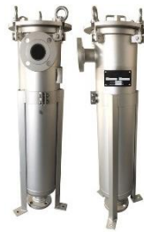
Gambar II.2 Single bag housing filter