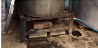
Gambar 8 Kompor

Alat ini berfungsi sebagai perapian yang digunakan untuk merebus kedelai.