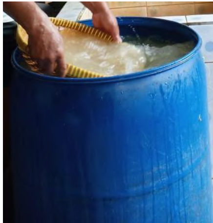
Gambar 11 Drum Pencucian

Alat ini terbuat dari plastik yang berfungsi untuk mencuci kedelai.