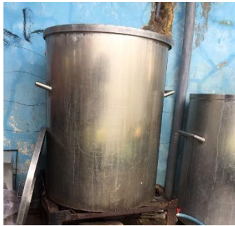
Gambar 9 Panci perebusan

Alat ini terbuat dari logam alumunium yang berfungsi untuk merebus kedelai dengan maksimal kapasitas 50 kg.