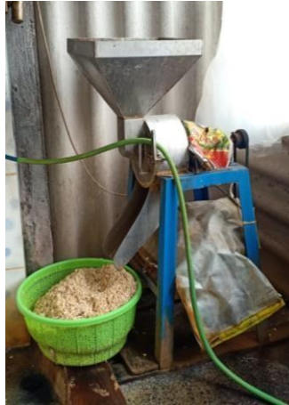
Gambar 6 Mesin Penggilingan Kedelai

Mesin penggiling kedelai berfungsi untuk memecah kacang kedelai agar terbelah dan berfungsi sebagai pengupas kulit ari kacang kedelai. Alat penggiling terbuat dari bahan full stainless steel dimana akan mampu menghasilkan gilingan dengan terjamin higienitas dan juga kebersihannya dan mempunyai kapasitas 15-20 kg per jam.