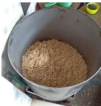
Gambar 10 Panci Penirisan

Alat ini terbuat dari logam alumunium yang didalamnya terdapat saringan yang berfungsi untuk meniriskan kedelai yang telah dicuci.