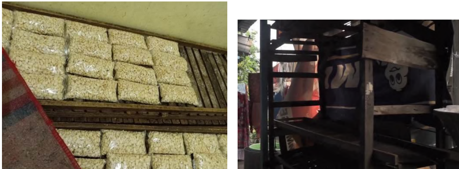
Gambar 12 Tempat Pemeraman

Alat ini terbuat dari bambu yang berguna untuk fermentasi ragi tempe agar dapat berkembang menjadi misellia .