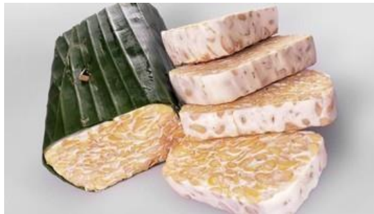
Gambar 3 Tempe

Tempe adalah produk fermentasi yang berbahan dasar kedelai dengan bantuan kapang Rhizopus dan mempunyai nilai gizi yang baik. Tempe ditandai dengan pertumbuhan kapang yang hampir tetap dan tekstur lebih kompak (Alvina, 2019).