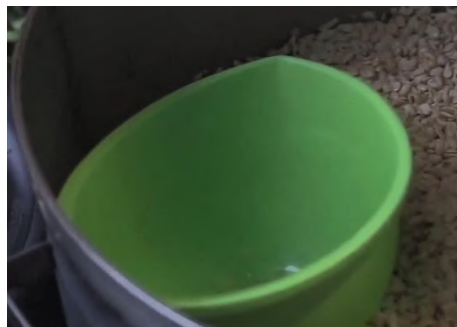
Gambar 7 Baskom

Alat ini digunakan untuk mengambil kedelai kemudian ditempatkan pada tempeh pencetak kedelai.