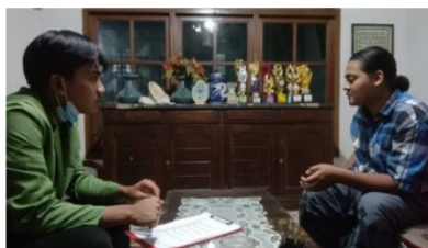
Gambar 1. Kegiatan pengisian kuisisioner

13 Dokumentasi pada saat pengisian kuisisioner dapat dilihat pada Gambar 1 dan 2. Hasil yang diperoleh berdasarkan setiap pertanyaan yang diberikan pada saat kuisisioner ke responden sebelum dan sesudah dilakukannya sosialisasi dapat dilihat pada penjelasan berikut