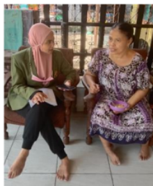
Gambar 2. Sosialisasi door to door

Berdasarkan hasil yang diperoleh (Tabel 1), pertanyaan pertama terkait mencuci tangan sebelum mengelola makanan dengan diberi tiga jawaban serta terdapat skor setiap jawaban yang dipilih. Jawaban yang diberikan tersebut berupa selalu (5 point), kadang-kadang (2 point) dan tidak pernah (1 point). Dari hasil yang didapat, dapat diketahui bahwa pelaku UMKM selalu