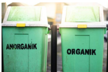
Gambar 2. Pemisahan sampah organik dan anorganik

Edukasi pertama kali yang telah disampaikan kepada warga oleh tim pengabdian kepada masyarakat (PkM) pada penyuluhan ini ialah pentingnya pemisahan sampah organik dan anorganik. Pemisahan sampah organik dan anorganik sangat berguna bagi pengolahan dan pengelolaan sampah berikutnya. Tujuan utama dari pemisahan sampah ini yaitu untuk memudahkan tahapan pengolahan sampah selanjutnya.