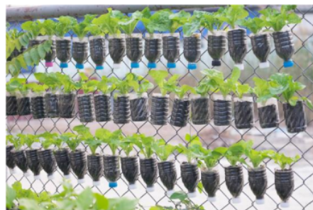
Gambar 3. Contoh reuse botol plastik bekas

bagi masyarakat. Sampah organik memiliki potensi untuk diolah dalam reaktor biogas hingga menjadi gas metana sebagai energi yang berkelanjutan dan ramah lingkungan (Khaidir, 2015). Sementara itu, sampah anorganik dapat didaur ulang atau dikirim ke tempat pembuangan akhir (TPA).