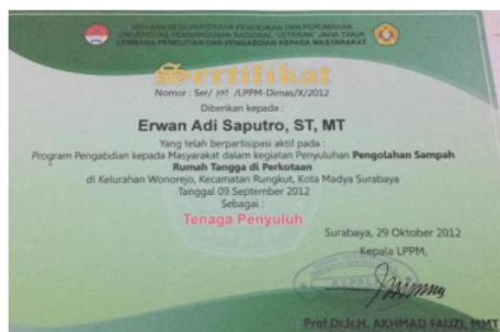
Gambar 4. Penghargaan kepada tenaga penyuluh

Lebih dari itu, tempat sampah sebaiknya dibersihkan dan disterilkan secara periodik. Pembersihan tempat sampah tersebut dapat dilakukan bila tempat sampah telah penuh. Sampah organik yang telah memenuhi tempat sampah harus segera dibuang atau diolah menjadi pupuk organik atau biogas. Sedangkan, sampah anorganik yang telah memenuhi kapasitas tempat sampah juga harus segera dibuang ke tempat pengolahan sampah terpadu (TPS). Atau, sampah anorganik yang sekiranya dapat dimanfaatkan menurut prinsip 3R dapat dipilah dan diolah sendiri. Bila sampah telah dipindahkan, tempat sampah dapat dibersihkan dan disterilisasi serta plastik dapat diganti dengan yang baru dan bersih.