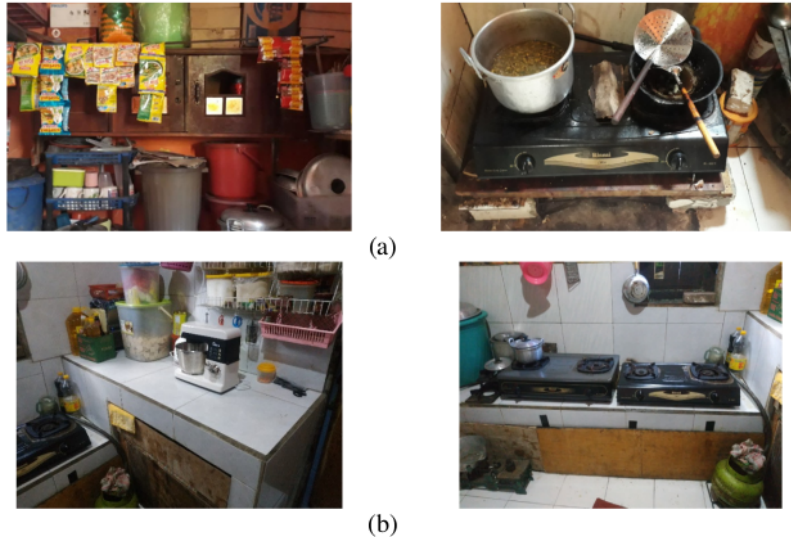
Gambar 4 Kondisi ruangan produksi (a) sebelum kegiatan PKM, (b) setelah kegiatan PKM

Pada materi sanitasi peralatan, tim penyuluh menekankan pada pencucian peralatan yang diunakan, seperti mencuci alat dari stainless steel dengan air hangat dan sabun, membersihkan dan mengeringkan wadah sebelum dan setelah digunakan dan mengecek ketajaman alat pemotong. Hasil yang didapatkan cukup positif karena berdasarkan hasil diskusi, mitra lebih paham pentingnya mengeringkan wadah sebelum dan sesudah digunakan dan selalu mengecek ketajaman alat pemotong.