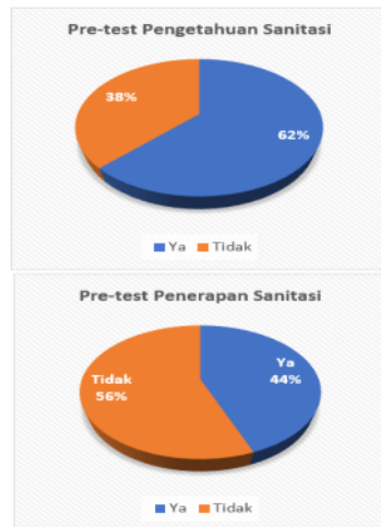
Gambar 1. Hasil Pre-test Pengetahuan sanitasi (a) dan Penerapan Sanitasi (b)