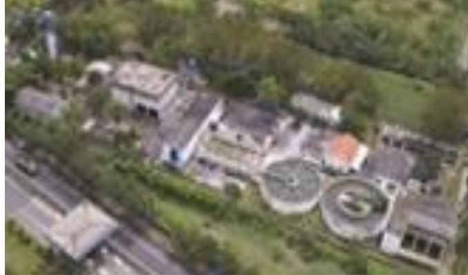
Gambar 1. 4 Instalasi penjernihan air PT. Petrokimia

industri yang semakin meningkat, PT Petrokimia Gresik melakukan Uprating Proyek IPA Gunungsari sebesar 3.000 m 3 /jam.