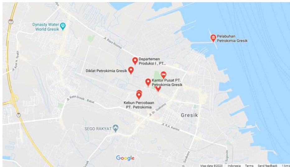
Gambar 1. 1 Peta lokasi PT. Petrokimia Gresik

Kantor cabang PT. Petrokimia Gresik terletak di Jalan Tanah Abang III No.16 Jakarta Pusat