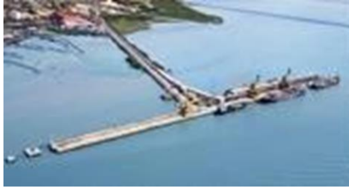
Gambar 1. 2 Dermaga di PT. Petrokimia Gresik

bahan kimia cair berkapasitas 60 ton/jam untuk Amoniak dan 90 ton/jam untuk Asam Sulfat. Dan juga memiliki dermaga khusus batubara dengan kapasitas bongkar muat mencapai 480.000 ton/tahun.