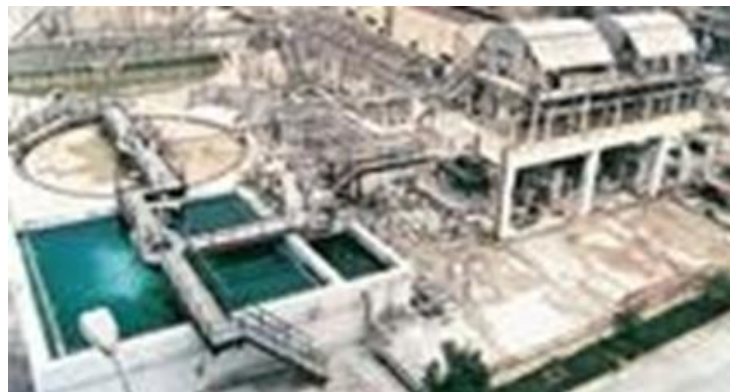
Gambar 1. 5 Unit pengolahan limbah PT. Petrokimia

Sebagai perusahaan berwawasan lingkungan, PT Petrokimia Gresik terus berupaya meminimalisir adanya limbah sebagai akibat dari proses produksi, sehingga tidak membahayakan lingkungan sekitarnya. PT Petrokimia Gresik melakukan pengolahan limbah dengan menggunakan sistem reuse, recycle, dan recovery (3R) dengan dukungan: unit pengolahan limbah cair berkapasitas 240 m 3 /jam, fasilitas pengendali emisi gas di setiap unit produksi, diantaranya bag filter, cyclonic separator, dust collector, electric precipitator (EP), dust scrubber, dll.