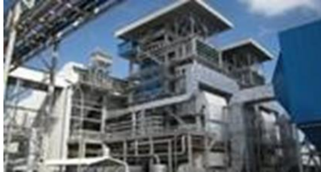
Gambar 1. 3 Unit utilitas batubara PT. Petrokimia Gresik