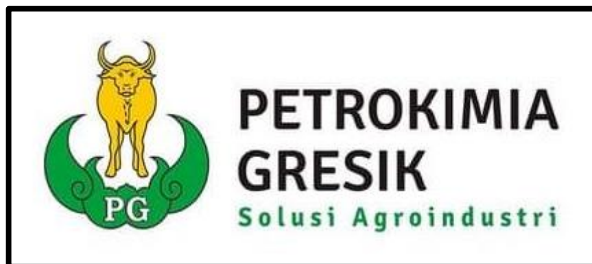
Gambar 1.4 Logo PT. Petrokimia Gresik

PT. Petrokimia Gresik memiliki logo yaitu seekor kerbau berwarna kuning emas dan daun hijau berujung lima dengan huruf PG berwarna putih yang terletak ditengahnya seperti Gambar 1.4.