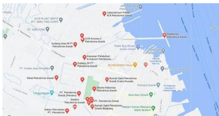
Gambar 1.2 Peta lokasi PT. Petrokimia Gresik