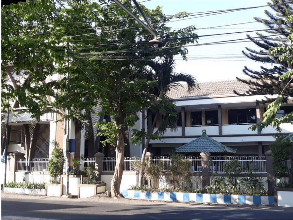
Gambar 2.3 Gedung A SMA Antartika Sidoarjo