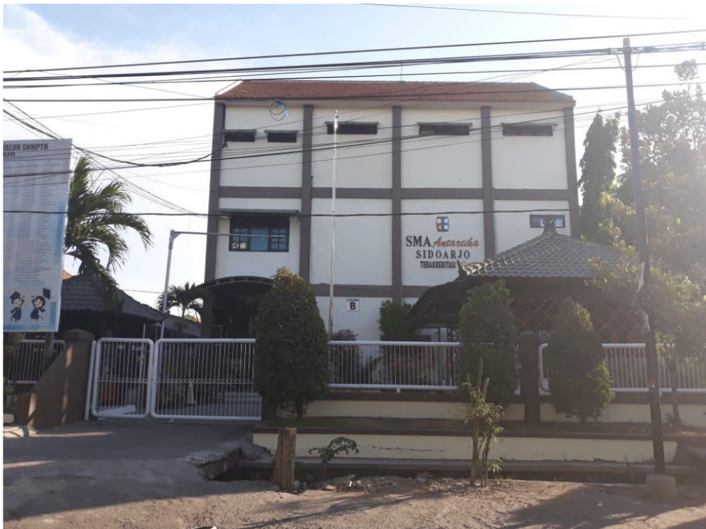
Gambar 2.4 Gedung B SMA Antartika Sidoarjo