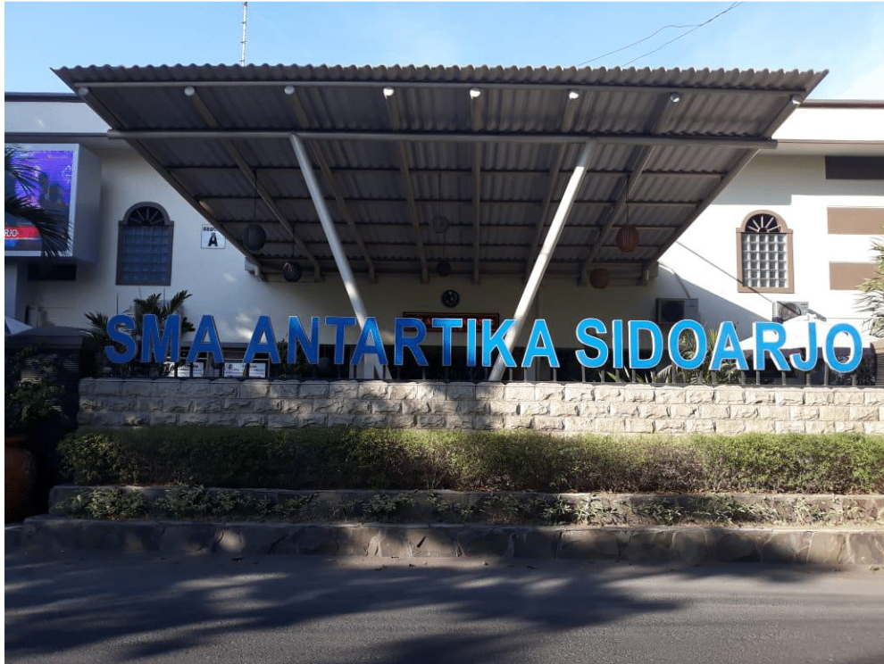
Gambar 2.2 SMA Antartika Sidoarjo

Dokumentasi SMA Antartika Sidoarjo, sebagai berikut :