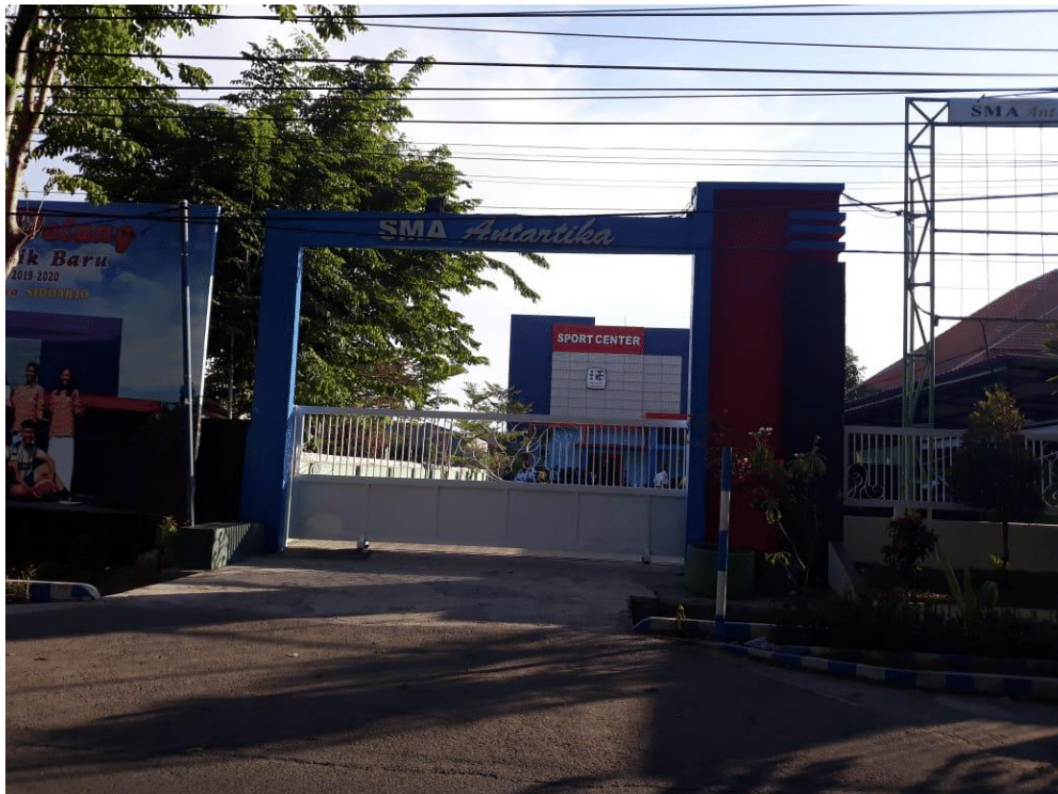
Gambar 2.5 Gedung Serba Guna SMA Antartika Sidoarjo

Tidak hanya memiliki Gedung A dan Gedung B SMA Antartika Sidoarjo juga memiliki Gedung Serba Guna yang digunakan untuk menunjang kegiatan – kegiatan yang diadakan oleh sekolah, dan juga sebagai prasarana yang biasa digunakan untuk olahraga yang diberi nama sport center.