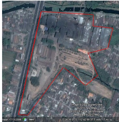
Gambar I.2.1. Peta Letak PT.PG Candi Baru

PG. Candi Baru terletak di desa Candi, Kecamatan Candi, Kabupaten Sidoarjo, Jawa Timur. Pabrik tersebut terletak diinggir jalan Surabaya-Malang, kurang lebih 26 km dari Surabaya dan 3 km dari Sidoarjo dengan ketinggian 4 m diatas permukaan laut.