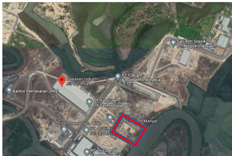
Gambar I.5 2 Peta Lokasi Kawasan Industri JIIFE