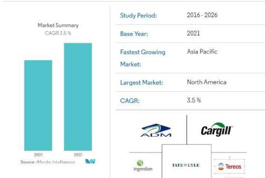
Gambar I.1. Trend Market Glukosa

pemanis dalam industri makanan dan minuman mengalami peningkatan permintaan yang signifikan.