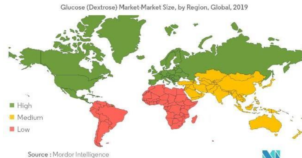
Gambar I.2. Pertumbuhan Pasar Glukosa Berdasarkan Wilayah

Wilayah Asia Pasifik diperkirakan menjadi pasar utama konsumsi glukosa atau dekstrosa. Meningkatnya permintaan industri makanan dan minuman yang mengandung glukosa, industri farmasi, serta terjangkaunya sumber dari glukosa dalam skala besar di negara China, India, Jepang, serta Indonesia akan mendorong permintaan glukosa di negara-negara tersebut.