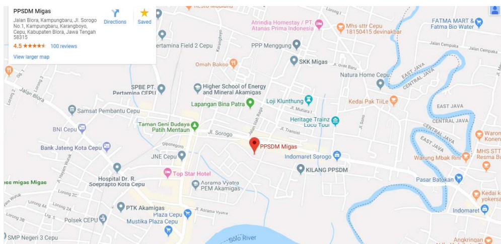
Gambar I. 1. Peta Lokasi PPSDM Migas Cepu

Pusat Pengembangan Sumber Daya Manusia Minyak dan Gas Bumi berlokasi di Jalan Sorogo 1, Kelurahan Karangboyo, Kecamatan Cepu, Kabupaten Bora, Provinsi Jawa Tengah, Kode pos 58315. Luas area sarana dan prasarana seluas 129 hektar.