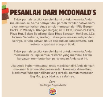
Gambar 1. Kampanye Burger King

melakukan kampanye melalui sosial media dengan cara mempromosikan beberapa merek pesaingnya sebagai bentuk solidaritas karena penjualan mereka menurun di saat pandemi. Pesan yang disampaikan melalui sosial media tersebut berisi permintaan kepada konsumen untuk melakukan pembelian di restoran pesaingnya seperti Mc Donald, KFC dan beberapa merek lokal lainnya agar dapat tetap bertahan selama pandemi terus berlangsung seperti ditunjukkan pada Gambar 1.