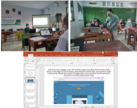
Gambar 3. Dokumentasi Pendampingan Pembuatan e-mail dan Blog