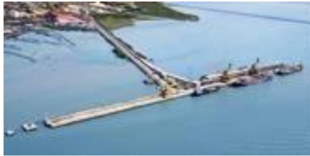
Gambar I.4 Dermaga di PT. Petrokimia Gresik

ton/jam, serta belt conveyor dengan panjang keseluruhan mencapai 22 km. Dermaga PT Petrokimia Gresik juga dilengkapi fasilitas untuk bongkar muat bahan kimia cair berkapasitas 60 ton/jam untuk Amoniak dan 90 ton/jam untuk Asam Sulfat. Dan juga memiliki dermaga khusus batubara dengan kapasitas bongkar muat mencapai 480.000 ton/tahun.