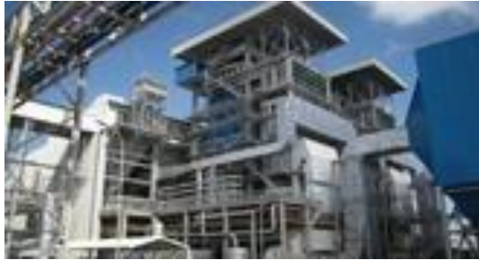
Gambar I.5 Unit utilitas batubara PT. Petrokimia Gresik

Selain untuk mensuplai kebutuhan listrik ke Pabrik II, pengoperasian Unit Utilitas Batubara juga mampu menghemat penggunaan gas sebesar 6,3 MMSCFD.