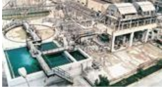
Gambar I.7 Unit pengolahan limbah di PT. Petrokimia Gresik