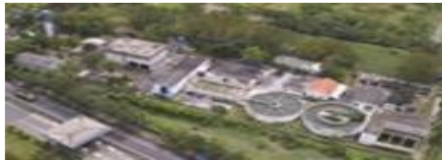
Gambar I.6 Instalasi penjerhihan air di PT. Petrokimia Gresik

melalui pipa sepanjang 22 km. IPA Babat di Lamongan memanfaatkan bahan baku air dari Sungai Bengawan Solo yang dialirkan melalui pipa sepanjang 60 km. Total kapasitas dua instalasi ini sebesar 3.200 \text{ m}^3/\text{jam} . Untuk memenuhi kebutuhan air industri yang semakin meningkat, PT Petrokimia Gresik melakukan Uprating Proyek IPA Gunungsari sebesar 3.000 \text{ m}^3/\text{jam} .