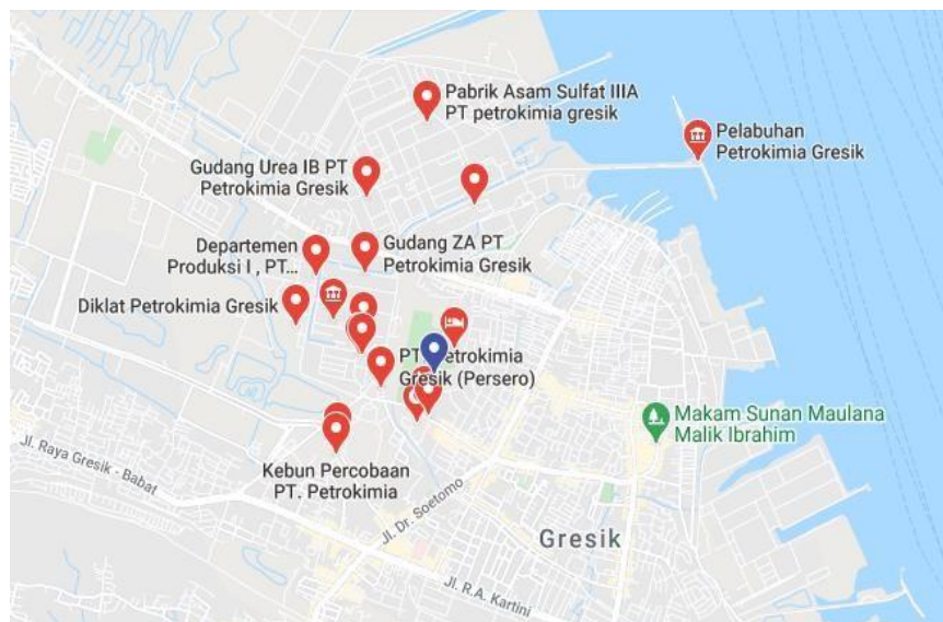
Gambar 1.2 Peta lokasi PT. Petrokimia Gresik