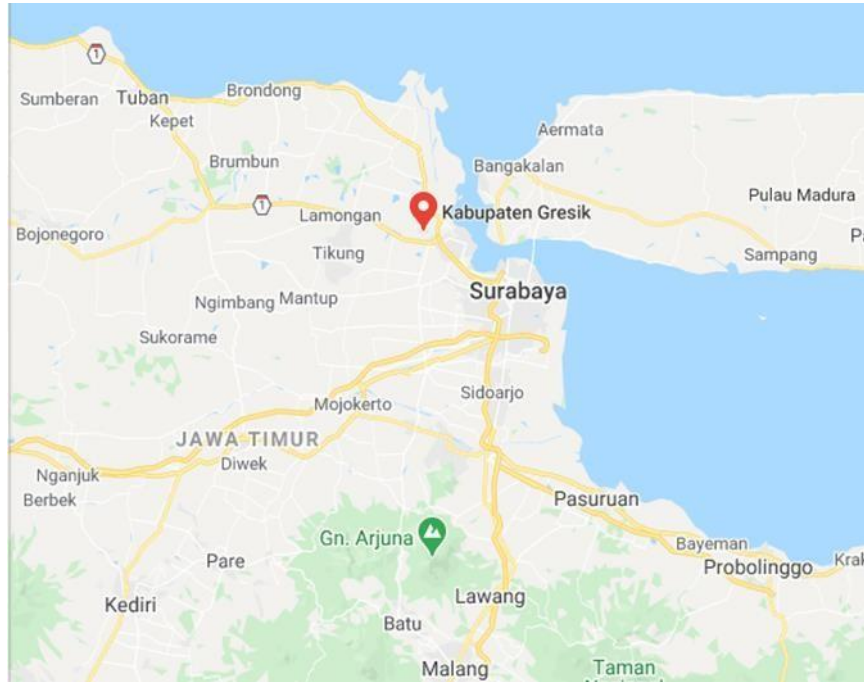
Gambar 1.1 Peta lokasi Kabupaten Gresik

Peta lokasi Kabupaten Gresik dan PT. Petrokimia Gresik dapat dilihat pada gambar 1.1 dan gambar 1.2.