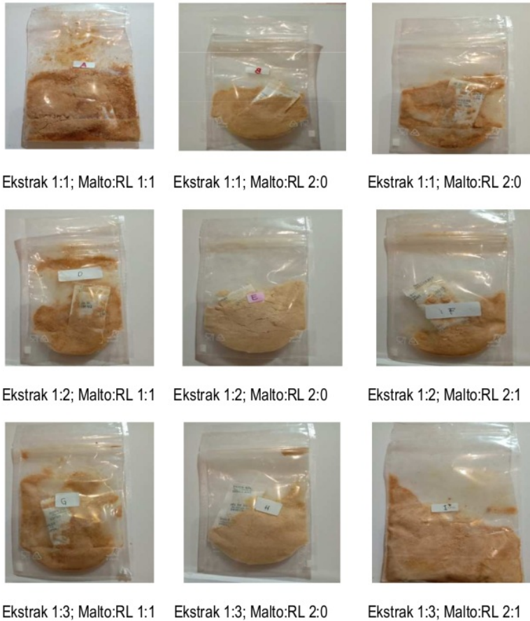
Gambar 3. Perbedaan warna dari semua perlakuan penelitian

Pada Tabel 3 menunjukkan bahwa derajat putih minuman fungsional berkisar 65.96 - 78.92. Pada proporsi buah mengkudu dengan air (1:1) dan proporsi maltodekstrin pati kimpul dengan rumput laut (1:1) menghasilkan nilai derajat putih paling rendah yaitu 65.96, sedangkan perlakuan proporsi buah mengkudu dengan air (1:3) dengan proporsi maltodekstrin pati kimpul dengan rumput laut (2:0) menghasilkan nilai derajat kecerahan