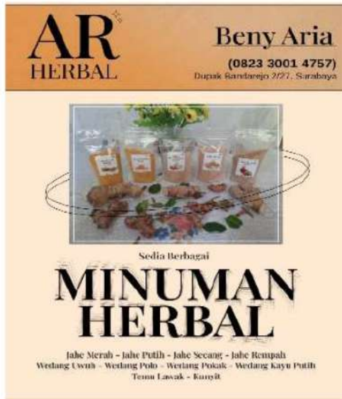
Gambar 11. Desain Poster