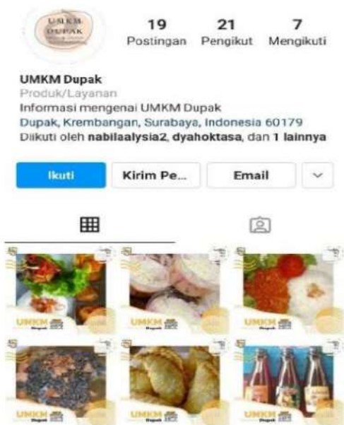
Gambar 5. Instagram UMKM Dupak