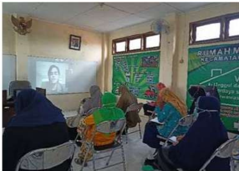
Gambar 12. Pelatihan mendesain ulang dan membuat logo