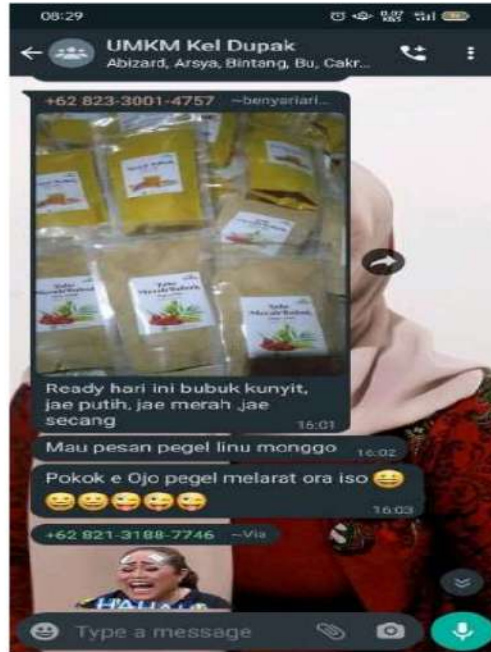
Gambar 7. Whatshapp UMKM Dupak

Sedangkan dampak negatif dari pemasaran secara online antara lain; pembeli kemungkinan akan terganggu dengan banyaknya layanan iklan online yang bersifat agresif atau bersifat memaksa. Sedangkan bagi penjual, berdagang online harus siap melayani pemesanan dari pembeli selama 24 jam dengan lebih sabar dan telaten.