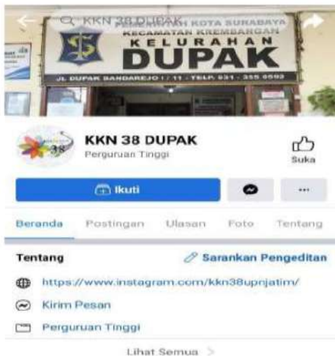
Gambar 6. Facebook UMKM Dupak