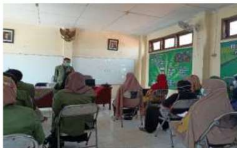
Gambar 2. Pelatihan pemasaran dan pengemasan oleh mahasiswa KKN