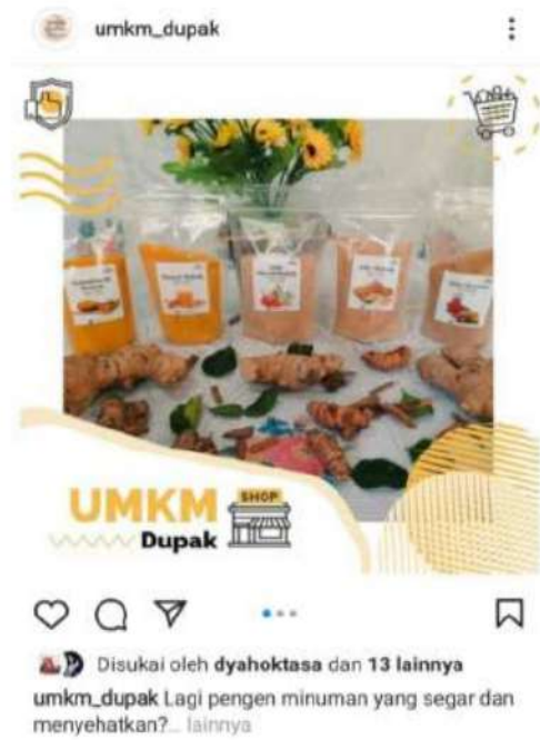
Gambar 9. Desain produk tampilan lama

Selanjutnya, sesuai dengan kata re- yaitu ulang, re-branding logo berarti mendesain ulang atau mendesain logo baru. Rebranding berdasarkan dilandasi oleh beberapa alasan misalnya brand akan bergabung dengan brand lainnya, perluasan produk, ganti kepemilikan, perbaikan citra, perubahan nama, dan lain sebagainya (Hastiningsih et al., 2021).