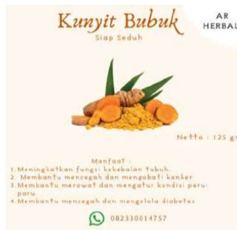
Gambar 10. Desain produk tampilan Baru

Setelah dilakukan pelatihan desain pengemasan dan pemasaran bersama para pemilik UMKM dan ibu-ibu PKK yang terdapat pada Kelurahan Dupak, maka terjalin adanya komunikasi berkelanjutan didalam grup Whatsapp yaitu antara pemilik UMKM dengan KKN Kelompok 38 UPN Veteran Jawa Timur. Pada Gambar 9 dan Gambar 10 terlihat perubahan desain dari desain lama ke desain baru. Gambar 10 menunjukkan adanya tambahan tulisan manfaat dan khasiat dari produk yang ditawarkan. Hal ini dapat membuat para konsumen dapat mengetahui apa saja manfaat yang akan diperoleh ketika mengonsumsi minuman herbal tersebut dan semakin yakin untuk membeli produk tersebut.