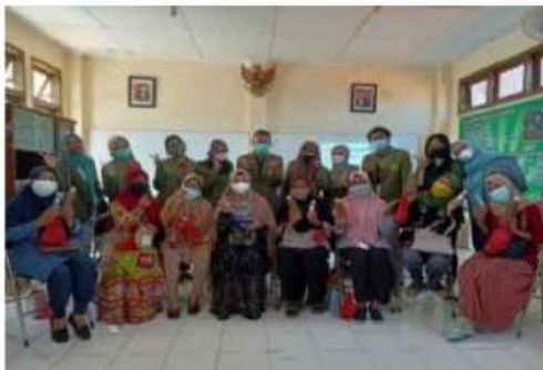
Gambar 12. Pelaku UMKM dan Tim Abdimas