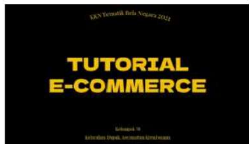
Gambar 8. Tutorial Pembuatan e-commerce

Dampak positif dan negatif dari pemasaran secara online yang telah disebutkan, menarik perhatian Divisi Kewirausahaan KKN Kelompok 38 dalam pemasaran secara online dengan memanfaatkan media sosial Instagram dengan memberikan tampilan feed yang segar, mudah dipahami, dan menarik perhatian dari pembeli/konsumen. Pemasaran secara online menggunakan Instagram dan e-commerce ini dinilai dapat membantu UMKM Dupak dalam memasarkan dan mempromosikan produk.