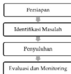
Gambar 1. Diagram alir kegiatan pengabdian masyarakat

Sedangkan tahapan pelaksanaan meliputi pelatihan mengenai desain pengemasan, pemasaran online dan re-branding kemasan UMKM Kelurahan Dupak. Kegiatan pengabdian kepada masyarakat ini juga membantu dalam pembuatan serta memaksimalkan penggunaan akun media sosial sebagai wadah promosi produk UMKM, re-branding , logo dan stiker pada kemasan. Kemudian tahapan evaluasi dan monitoring sebagai upaya pendampingan pelaksanaan kegiatan pengabdian kepada masyarakat bagi UMKM Kelurahan Dupak.