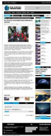
Gambar 8. Halaman subkategori sports

Halaman subkategori entertainment merupakan salah satu halaman