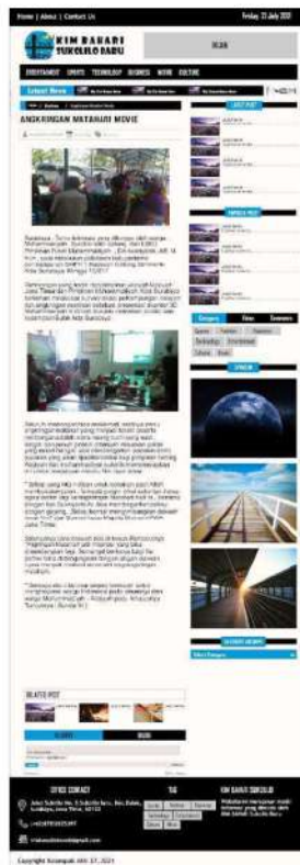
Gambar 11. Halaman subkategori movie

Halaman subkategori movie merupakan salah satu halaman dari website KIM Bahari yang berisikan informasi seputar film atau tontonan.