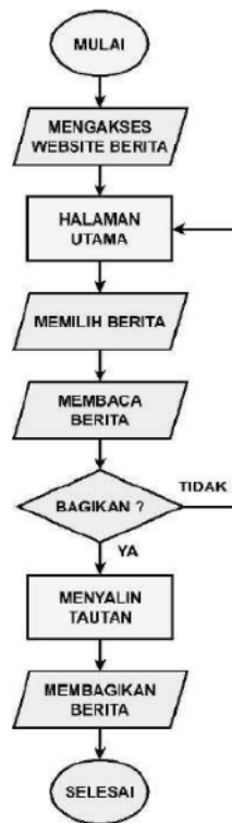
Gambar 2. Flowchart sistem

Pertama kali pengguna mengakses website , pengguna dapat melihat halaman utama dari tampilan website . Setelah itu pengguna dapat memilih berita sesuai dengan keinginan atau kebutuhan. Selanjutnya pengguna dapat membaca berita yang sudah dipilih. Dari sini, pengguna memiliki dua pilihan aktifitas, yang pertama adalah membagikan berita atau kembali ke halaman utama untuk memilih berita lain. Jika pengguna ingin membagikan berita, maka pengguna perlu terlebih dahulu menyalin tautan dan dilanjutkan dengan membagikan tautan tersebut ke orang lain. Namun, jika pengguna memilih untuk kembali ke halaman utama, maka pengguna akan mendapatkan tampilan halaman utama dan dapat memilih berita kembali.