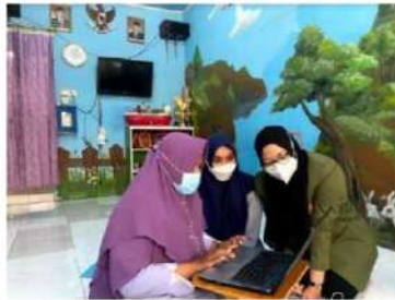
Gambar 13. Presentasi desain website KIM Bahari kepada admin website

Halaman subkategori culture merupakan salah satu halaman dari website KIM Bahari yang berisikan informasi seputar budaya.