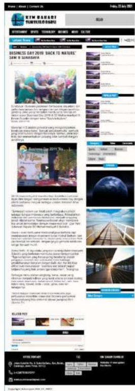
Gambar 10. Halaman subkategori business

Halaman subkategori technology merupakan salah satu halaman dari website KIM Bahari yang berisikan informasi seputar teknologi.