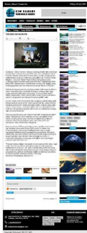
Gambar 9. Halaman subkategori technology

Halaman subkategori technology merupakan salah satu halaman dari website KIM Bahari yang berisikan informasi seputar teknologi.