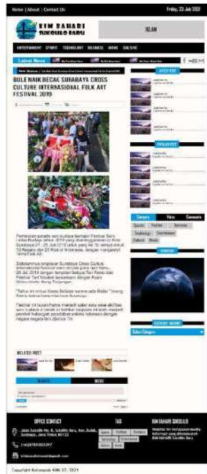
Gambar 12. Halaman subkategori culture

Halaman subkategori culture merupakan salah satu halaman dari website KIM Bahari yang berisikan informasi seputar budaya.