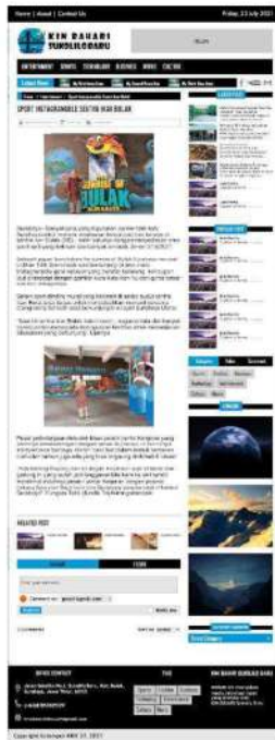
Gambar 7. Halaman subkategori entertainment

Halaman subkategori entertainment merupakan salah satu halaman