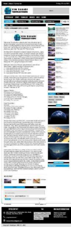
Gambar 5. Halaman about

Halaman about merupakan salah satu halaman dari website KIM Bahari yang berisikan