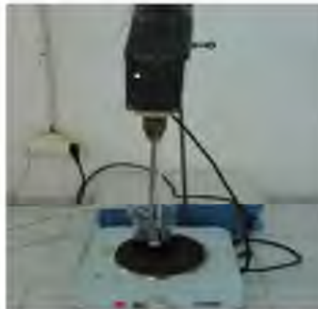
Gambar 1. Peralatan Penelitian