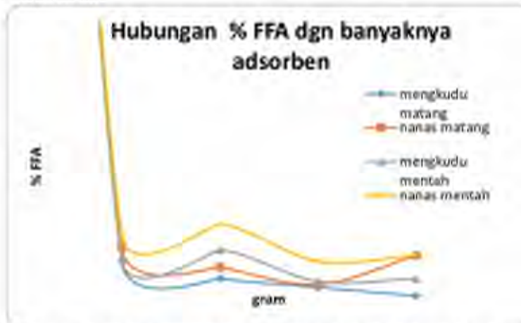
Gambar 3. Menunjukkan hubungan antara kadar asam lemak bebas (%) dengan banyaknya adsorben (gram).

goreng murni juga jumlah adsorben yang sedikit dan menghemat biaya, seperti terlihat pada gambar dibawah ini.