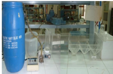
Gambar 1. Rangkaian Alat Penelitian Berupa Model Fisik

Model HP2S menghasilkan keluaran ( output ) berupa Bilangan Reynold, koefisien dispersi longitudinal dan vertikal, Bilangan Courant, gambar pola kecepatan aliran, NRe , NFr , kecepatan pengendapan dan konsentrasi pada arah sumbu x dan sumbu y (Karnaningroem, 2006).