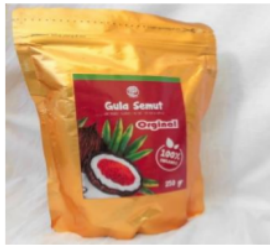
Gambar 7. Produk Gula Semut

gula darah, menstabilkan kolesterol, meningkatkan daya tahan tubuh, melancarkan peredaran darah, mencegah asam urat, dan mengurangi risiko stroke.