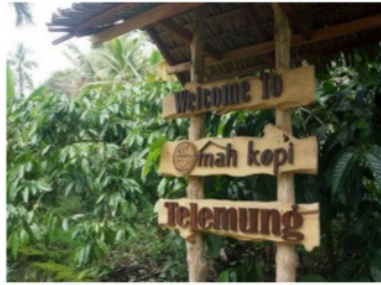
Gambar 4. Pintu Masuk Omah Kopi

Omah Kopi Luwak cocok untuk keluarga yang ingin berwisata, pecinta dan kolektor kopi Indonesia. Omah Kopi Luwak ditujukan untuk keluarga yang ingin mendapatkan pengalaman wisata berbeda setelah jenuh dengan aktivitas rutin. Omah Kopi Luwak juga ditujukan bagi para pecinta kopi yang rela menjelajah daerah-daerah untuk melengkapi koleksi kopi. Kami memiliki dua pilihan teknik pengolahan untuk menghasilkan karakter kopi berbeda. Pengolahan pertama dilakukan secara tradisional dan ditujukan bagi mereka yang gemar bertualang mencari citarasa kopi 'autentik' pengolahan kopi yang lainnya menggunakan mesin produksi sehingga para pecinta kopi dapat menikmati sajian kopi yang berkualitas dengan citarasa yang maksimal.