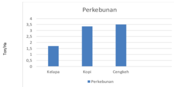
Gambar 2. Diagram Jumlah Komoditas Perkebunan

Telemung dalam sektor perkebunan yaitu sebagai berikut.