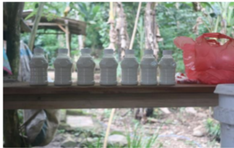
Gambar 6. Kemasan Susu Kambing Etawa

Susu Kambing Etawa merupakan salah satu produk ternak yang memiliki kandungan nutrisi yang tinggi. Menurut hasil dari penelitian yang dilakukan oleh United State Departement of Agriculture (USDA) menunjukkan gizi susu kakegumbing etawa mendekati komposisi sempurna ASI. Setiap 100 gram susu kambing mengandung 3-4% protein, 4-7% lemak, 4,5% karbohidrat, 134 gram kalsium dan 111 g fosfor. Komposisi kimiawi susu kambing etawa mengandung protein, lemak, karbohidrat, kalori, kalsium, fosfor, magnesium, besi, natrium, kalium, vitamin A,B1 (IU), B2 (mg), B6, B12, C, D, E, Niacin, V, Asam Pantotenant, Kolin dan Inositol. Anak yang mengkomsumsi susu kambing memiliki kepadatan tulang yang baik, kadar hemoglobin meningkat, serta kecukupan vitamin A, B1, B2 dan B3 yang penting bagi pertumbuhan dan perkembangan sel otak dan saraf. Asam amino yang mengandung unsur belerang metionin, sistin dan sistein penting untuk membangun kesehatan otak dan sistem saraf, serta berperan dalam pembentukan sel darah penawar racun ( detoksifikasi ) bahan kimia berbahaya yang masuk ke dalam tubuh.