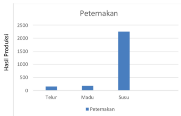
Gambar 3. Diagram Jumlah Komoditas Peternakan

Gambar 2 memperlihatkan hasil perkebunan terbesar di Desa Telemung Kecamatan Kalipuro Kab. Banyuwangi dari diagram di atas yaitu kopi sebesar 3,34 ton/ha, cengkeh sebesar 3,075 ton/ha, dan terendah yaitu kelapa 1,7 ton/ha. Dan selanjutnya, diagram ketiga menunjukkan komoditas terbesar di Desa Telemung dalam sektor peternakan sebagai berikut.