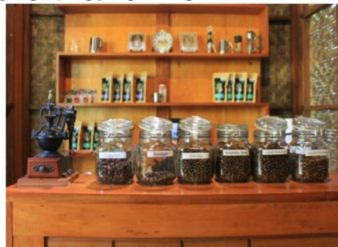
Gambar 5. Produk Omah Kopi

Para pengunjung dapat merasakan pengalaman ketika panen di bulan Juli hingga bulan Oktober. Selain di musim panen, pengunjung dapat ke omah kopi luwak di hari-hari biasa maupun di akhir pekan. Pengunjung yang datang ketika musim panen akan diberikan kesempatan untuk memetik buah kopi di perkebunan yang dikelola. Namun, para pengunjung diharapkan melakukan reservasi atau konfirmasi terlebih dahulu bila ingin datang ke omah kopi luwak, karena tempat wisata ini menjaga kualitas pendampingan setiap pengunjung yang datang.