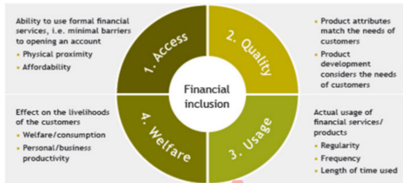
DIAGRAM 1. KOMPONEN FINANCIAL INCLUSION

Keuangan inklusif merupakan konsep yang multi disiplin dan terdiri atas beberapa komponen, yang semuanya relevan dengan agenda pembangunan di sebuah negara. Bank Indonesia (2014) memandang bahwa untuk mengetahui sejauh mana perkembangan proses keuangan inklusif diperlukan suatu ukuran kinerja. Alliance for Financial Inclusion (2010) secara umum mendefinisikan kompleksitas keuangan inklusif ke dalam 4 (empat) komponen, sebagai berikut: