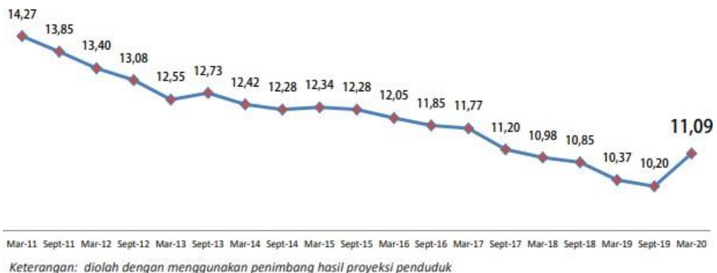
Gambar 1.1 Presentase Penduduk Miskin di Jawa Timur Tahun 2011-2020