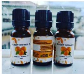
Gambar 3. Pengemasan Minyak Atsiri Kulit Jeruk

Selama proses kegiatan penyuluhan dan pelatihan berlangsung, peserta tampak antusias dalam mengikuti jalannya kegiatan. Hal ini dapat dilihat dari peserta yang memberikan beberapa pertanyaan kepada pemateri dan juga terlibat dalam diskusi juga ikut serta dalam proses perangkaian dan pemakaian alat.