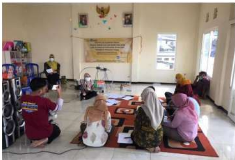
2 Gambar 1. Pemaparan Materi Mengenai Ekstraksi Minyak Atsiri dari Limbah Kulit Jeruk

Peralatan ekstraksi minyak atsiri yang digunakan pada kegiatan ini adalah rangkaian distilasi uap sederhana (Gambar 2). Peralatan ini terdiri dari beberapa bagian utama yaitu bejana yang berfungsi sebagai wadah untuk mengontakkan uap air dengan kulit jeruk manis, kondensor untuk mengkondensasi uap campuran minyak dan air, dan juga wadah penampung hasil distilasi. Selain itu juga menggunakan peralatan pemisah campuran minyak dan air dimana digunakan corong pemisah. Dengan peralatan yang cukup sederhana ini diharapkan anggota kelompok mitra mampu mengoperasikannya secara mandiri.