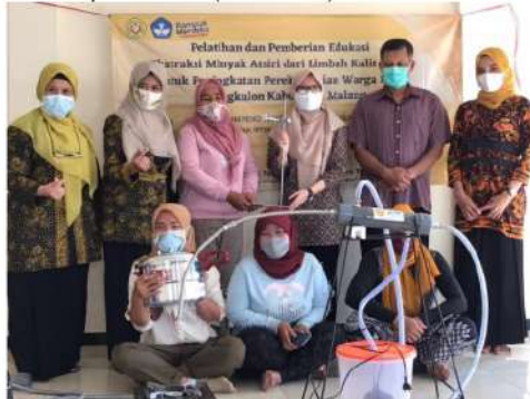
Gambar 4. Penyerahan Rangkaian Alat dan Peralatan Pendukung Lainnya

Selain proses produksi, mitra juga diajarkan cara dalam mengemas produk minyak atsiri. Dimana terdapat berbagai variasi volume botol yang dapat digunakan, salah satunya dengan menggunakan botol kaca gelap berukuran 10 mL. Botol juga perlu ditambahkan label yang dapat berisi informasi jenis minyak atsiri, kandungan, volume, kegunaan, dan informasi produsen (Gambar 3). Dalam kegiatan ini juga telah diserahkan rangkaian alat untuk proses distilasi minyak atsiri kepada mitra (Gambar 4).