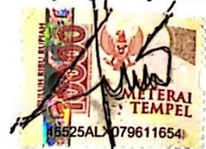
Ahmad Bayu Bagas Samudra

Surabaya, 30 September 2023 yang menyatakan,