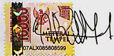
Arinil Ula Fil 'Izza

Surabaya, 27 Desember 2023 yang menyatakan,