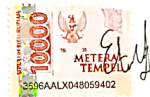
ETY NILA NIKMATI

Surabaya, 15 Januari 2024 Yang menyatakan,