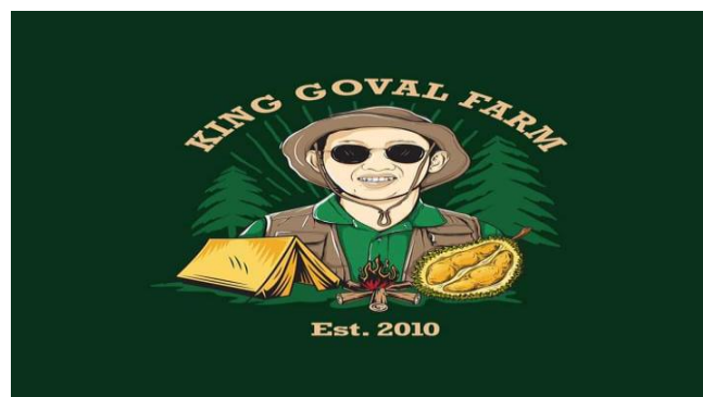
Gambar 1. 3 Logo King Goval Farm

King Goval Farm mempromosikan produknya dengan menggunakan jasa influencer hanya saja pada saat soft opening dan grand opening karena budget yang dikeluarkan untuk membayar influencer tergolong lebih besar dibandingkan dengan pemasaran melalui digital marketing lainnya. Kedua fenomena tersebut sangat populer dalam dunia marketing saat ini hal tersebut tentu menjadi peluang sekaligus tantangan bagi King Goval Farm sendiri. Sebagai usaha baru harus membangun citra mereka di ranah digital. Selain melakukan pemasaran melalui social media dan Influencer agar perusahaan semakin kuat dan mampu bersaing maka perusahaan harus menciptakan Brand image yang baik. Gambar 1.4 di bawah ini merupakan salah satu brand image berdasarkan atribut produk yang sudah melekat pada King Goval Farm .