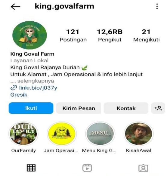
Gambar 1. 1 Tampilan Akun Instagram King Goval Farm

Gambar 1.2 dibawah ini merupakan tampilan salah satu platform social media King Goval Farm yaitu instagram yang memiliki 12,6 ribu followers .