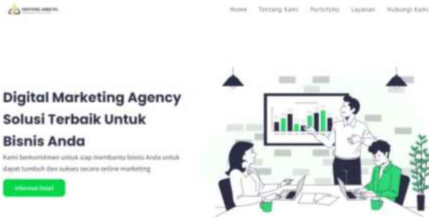
Gambar 2.2 Website Insting Marketing