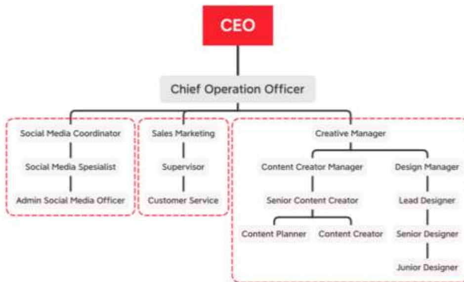
Gambar 2.5 Struktur Organisasi Perusahaan