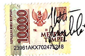
Agustin Angelika Rosida

Surabaya, 9 Januari 2024 yang menyatakan,