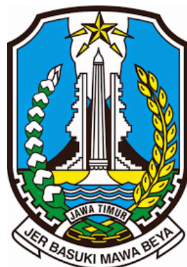
Gambar 2. 2 Logo Instansi Dinas Komunikasi dan Informatika

Dinas Komunikasi dan Informatika (KOMINFO) Provinsi Jawa Timur berada di bawah pemerintahan daerah yaitu Pemerintah Provinsi Jawa Timur sehingga logo yang digunakan oleh KOMINFO JATIM sama dengan logo pemerintahan daerah Provinsi Jawa Timur.